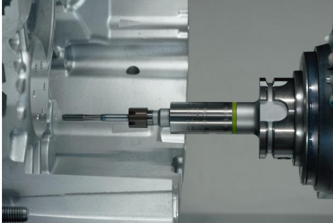
Bild 1: Das Softsynchro® Slim überzeugt durch eine sehr kompakte Bauweise und eignet sich daher für den Einsatz bei herausfordernden Störkonturen.